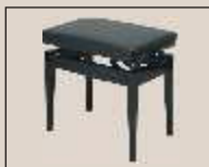
Abb. oben "schwarz poliert", Sitzbezug "Leder" weitere Farben und Sitzbezüge sowie mit gezapften oder zerlegbaren Beinen lieferbar