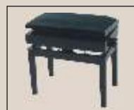
Abb. oben "schwarz poliert", Sitzbezug "Microfaser" weitere Farben und Sitzbezüge lieferbar Modell mit zerlegbaren Beinen