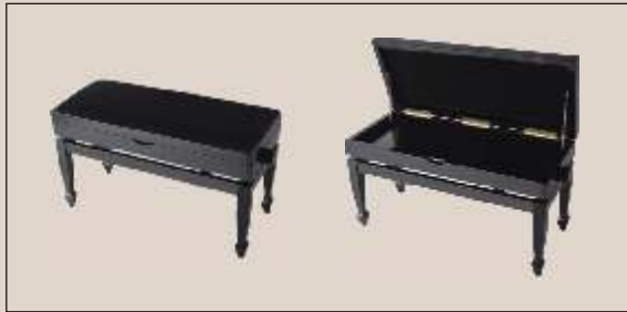
Mod. B 88 "schwarz poliert", Sitzbezug "Vélour" mit Notenfach