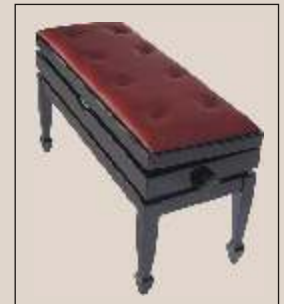
Sitzbezug "Leder kapitoniert rot"