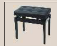
Abb. oben "schwarz poliert", Sitzbezug "Leder" weitere Farben und Sitzbezüge sowie mit gezapften oder zerlegbaren Beinen lieferbar