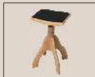
Abb. oben "Kirsche antik matt", Sitzbezug "Stoff" weitere Farben und Sitzbezüge lieferbar