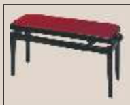
Abb. oben “schwarz poliert”, Sitzbezug “Vélour” weitere Farben und Sitzbezüge lieferbar