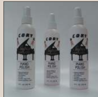
“Cory” Super High-Gloss Piano Politur