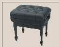
Abb. oben "schwarz poliert", Sitzbezug "Leder" weitere Farben und Sitzbezüge sowie mit gezapften oder zerlegbaren Beinen lieferbar