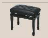
Abb. oben "schwarz poliert", Sitzbezug "Leder" weitere Farben und Sitzbezüge lieferbar