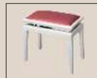
Abb. oben "weiß poliert", Sitzbezug "Stoff" weitere Farben und Sitzbezüge lieferbar