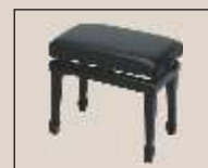
Abb. oben "schwarz poliert", Sitzbezug "Leder" weitere Farben und Sitzbezüge lieferbar