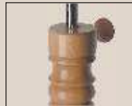
Abb. oben "Erle matt" weitere Farben lieferbar