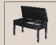
Abb. oben "schwarz poliert", Sitzbezug "Leder" weitere Farben und Sitzbezüge lieferbar Modell mit Notenfach unter dem Sitz