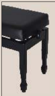
wahlweise auch mit anderen Beinen

Alle Modelle dieser Doppelseite sind wahlweise auch mit anderen Beinen und Füssen lieferbar