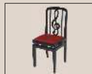
Abb. oben "schwarz poliert", Sitzbezug "Vélour" weitere Farben und Sitzbezüge lieferbar