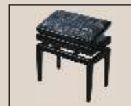
Abb. oben "schwarz poliert", Sitzbezug "Microfaser" weitere Farben und Sitzbezüge lieferbar Modell mit gezapften Beinen