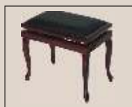
Abb. oben "Teak poliert", Sitzbezug "Microfaser" weitere Farben und Sitzbezüge lieferbar