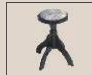
Abb. oben "schwarz poliert", Sitzfläche "Velour" weitere Farben und Sitzflächen lieferbar