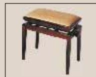
Abb. oben "Zwetschge matt", Sitzbezug "Microfaser" weitere Farben und Sitzbezüge lieferbar