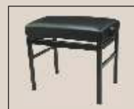
Abb. oben "schwarz matt", Sitzbezug "Kunstleder" weitere Farben und Sitzbezüge lieferbar