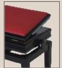
Mod. B 2001 mit individuell ein- stellbarer Nei- gung der Sitzfläche