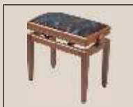
Abb. o. "Eiche rustikal matt", Sitzb. "Microfaser" weitere Farben und Sitzbezüge lieferbar