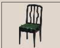
Abb. oben "schwarz poliert", Sitzbezug "Leder" weitere Farben und Sitzbezüge lieferbar