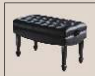
Abb. oben "schwarz poliert", Sitzbezug "Leder" weitere Farben und Sitzbezüge lieferbar