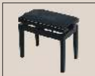
Abb. oben "schwarz poliert", Sitzbezug "Stoff" weitere Farben und Sitzbezüge lieferbar