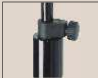
Abb. oben "schwarz poliert" weitere Farben lieferbar