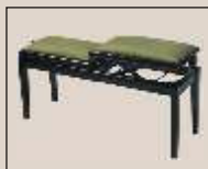
Abb. oben “schwarz poliert”, Sitzbezug “Leder” weitere Farben und Sitzbezüge lieferbar