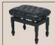
Abb. oben "schwarz poliert", Sitzbezug "Leder" weitere Farben und Sitzbezüge sowie mit gezapften oder zerlegbaren Beinen lieferbar