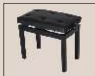
Abb. oben "schwarz poliert", Sitzbezug "Kunstleder" weitere Farben und Sitzbezüge lieferbar