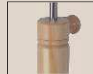
Abb. oben "Buche natur" weitere Farben lieferbar