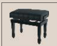
Abb. oben "schwarz poliert", Sitzbezug "Leder" weitere Farben und Sitzbezüge lieferbar