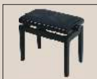
Abb. oben "schwarz poliert", Sitzbezug "Stoff" weitere Farben, Sitzbezüge und mit Glissando Komfortmechanik lieferbar