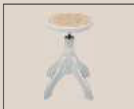
Abb. oben "Birnbaum matt", Sitzfläche "Bast" weitere Farben und Sitzflächen lieferbar