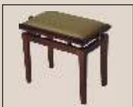
Abb. oben "Erle matt", Sitzbezug "Microfaser" weitere Farben und Sitzbezüge lieferbar