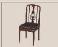
Abb. oben "schwarz poliert", Sitzbezug "Vélour" weitere Farben und Sitzbezüge lieferbar