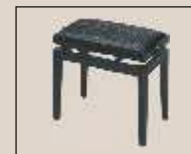
Abb. oben "schwarz poliert", Sitzbezug "Microfaser" weitere Farben und Sitzbezüge lieferbar