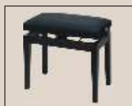
Abb. oben "Palisander matt", Sitzbezug "Stoff" weitere Farben und Sitzbezüge lieferbar speziell für E-Pianos