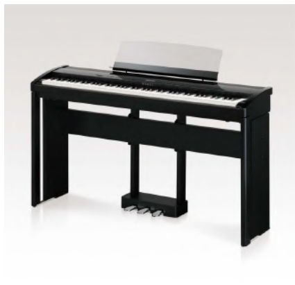
HM-4 Design Ständer, F-301 Dreifachpedal (separat erhältlich)

Spezifikationen können ohne Ankündigung geändert werden.