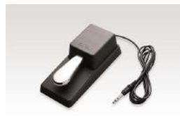
F-10H Dämpfer Pedal (stufenlos)