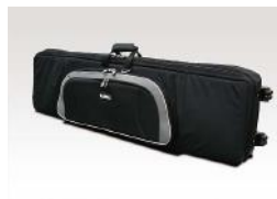
Stabiles Softcase mit Rollen